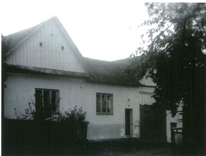
čp. 126 po přestavbě v r. 1960 - 61