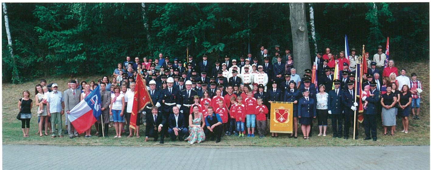
TUTO PŘÍLOHU PŘIPRAVIL J. ČIŽINSKÝ